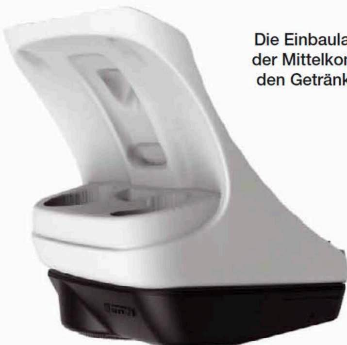
Die Einbaulage unter der Mittelkonsole mit den Getränkehaltern