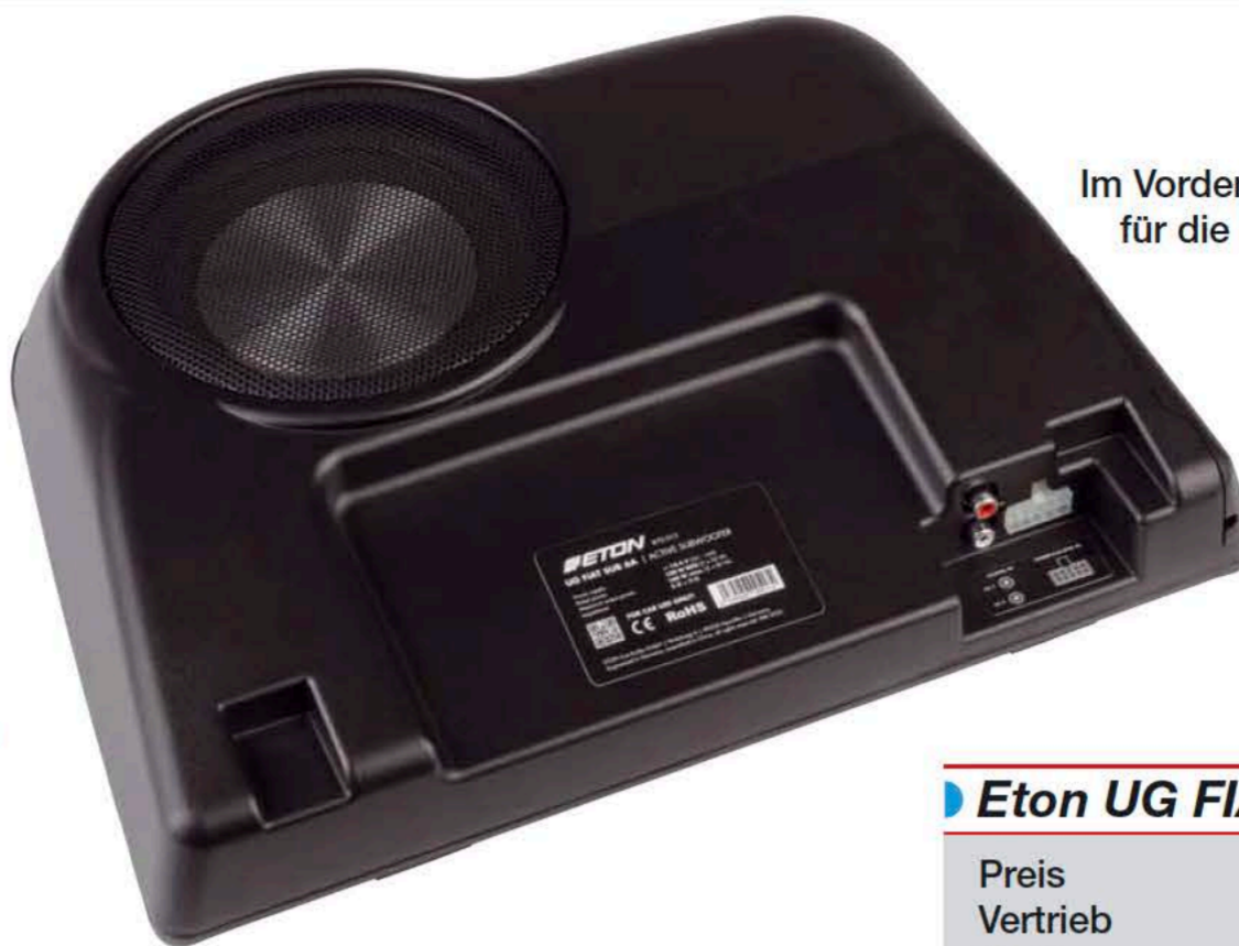
Im Vordergrund sind die Aussparungen für die Haltebügel erkennbar

KLANGTIPP Kompaktklasse CAR & HiFi 5/2022