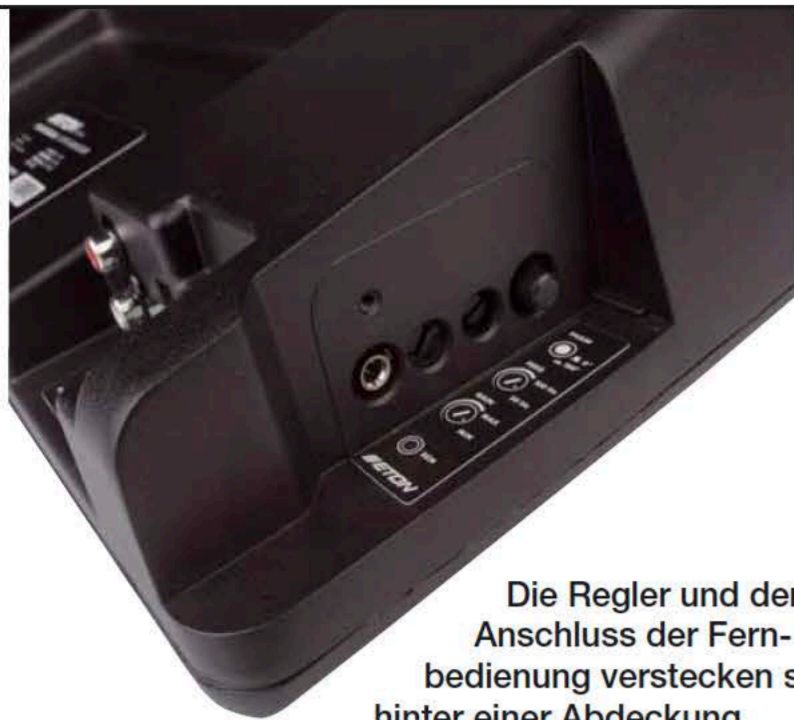
Die Regler und der Anschluss der Fernbedienung verstecken sich hinter einer Abdeckung