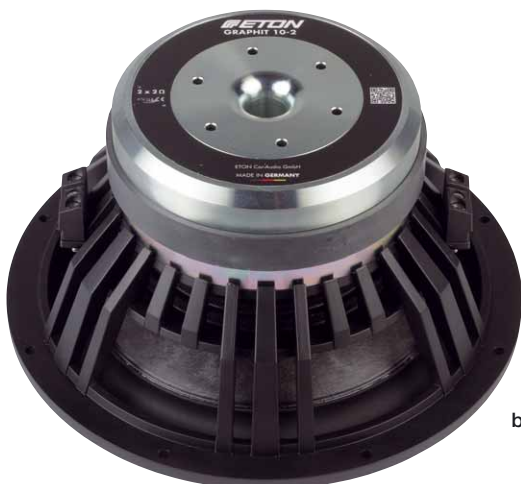
Die Fertigungsqualität mit dem wunderschönen Antrieb kann begeistern

Was ist als erstes mit einem Subwoofer Einzelchassis zu tun? Einschwingen und Parameter messen, danach zeigen die Graphit 10 Zwillinge sofort, wo es lang geht. 10-2 und 10-4 haben sehr kräftige Antriebe und niedrige Güten, was auch an einen Einsatz in ventilerten Gehäusen denken lässt. Eton emporhielt dies auch unter anderem, und zwar in erschreckend kleinen Gehäusen. Am hervorstechendsten sind bei den Woffern jedoch die niedrigen Resonanzfrequenzen, 22 Hz beim 10-4 und nur 20 Hz beim 10-2. Damit schreien die Woofer wiederum nach geschlossenen Gehäusen. Denn beim Einbau in ein Gehäuse steigt die Resonanzfrequenz an, je mehr, umso kleiner das Gehäuse. Hier sind die niedrigen Freiluftresonanzen der Etons ganz klasse, denn sie erzielen so in kompakten 16 Litern immer noch Einbauresonanzen von unter 40 Hz, das ist sehr niedrig und bedeutet jede Menge Tiefgang. Und genau das erleben wir dann auch im Hörtest. Die Graphit gehen unglaublich für Zehnzöller, sie benötigen zwar etwas Leistung, dann aber belohnen sie mit einer Vorstellung der Extraklasse. Wunderbar präzise folgen sie komplexen Bassläufen ungeachtet deren Tonlage. Es geht ohne Anstrengung bis in den tiefsten Frequenzkeller, wer gerne Orgelpfeifen hört,