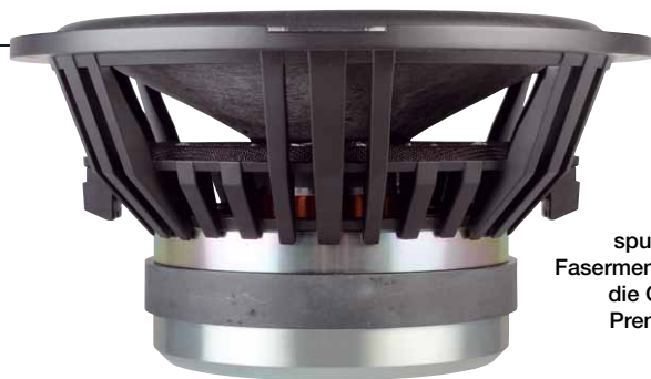
Große Schwingspulen und hightech Fasermembranen machen die Graphitwoofer zu Premiumsubwoofern

nungen für den Raum unter der Zentrierung. Die Schwingspule fällt mit 64 Millimetern stattlich aus für einen 10 Zoll Woofer, hier hat Eton nicht geizigt, sondern die Graphit Woofer im Sinne einer hohen Belastbarkeit gut bedacht. Die Spulen sind auf einem Aluminiumträger gewickelt, der hier als Kühlkörper wirkt, und als Extrakniff haben die Entwickler am Ende des Spulenträgers eine Aluminiumdustcap angebracht, die zusätzlich Kühlfläche bereitstellt. Die Membran drumherum ist wieder ein Spezialteil und charakteristisch für die Graphit Serie. Wahrscheinlich war sie auch Inspiration bei der Namensgebung. Sie besteht natürlich nicht aus Graphit, aber sie schimmert grau mit einer unregelmäßigen Zeichnung und es ist auch etwas Kohlenstoff drin. Ein Verbund aus Kohlefaser und Glasfaser sorgt im Sandwich für eine enorme Stabilität der Membran. Und zwar bei überschaubarer Materialstärke und damit geringem Gewicht. Ein Hightech Konstrukt, das sicher ein würdiger Nachfolger für Etons legendäre Hexacone Membran ist, die 185 patentiert wurde und über Jahrzehnte das Maß der Dinge war.